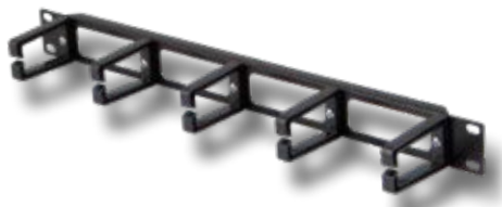
PASSA PERMUTE 1U CON APERTURE FRONTALI.