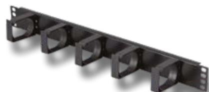
PASSA PERMUTE 1U.

Con 5 anelli in materiale termoplastico. Altezza 68 mm.