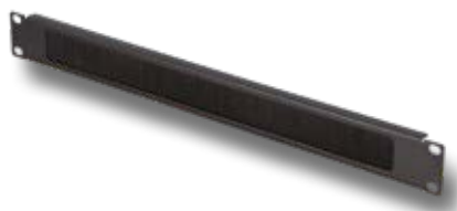
PASSA PERMUTE 1U A SPAZZOLA.