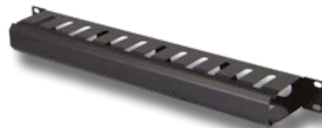
PASSA PERMUTE 1U CON COPERCHIO.