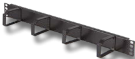
PASSA PERMUTE 1U.

Con 5 anelli in materiale termoplastico. Altezza 65 mm.